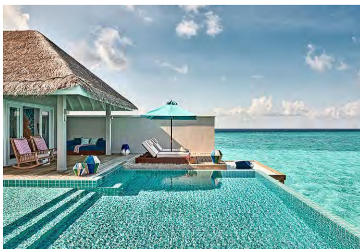
Mehr Meer geht nicht: Eine der Seaside-Villas

Aus Klein-Ibiza wurde ein designstarkes Resort, das Familien,